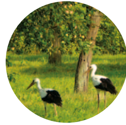
Młode bocki poszukujące pokarmu w starym sadzie

W skład pożywienia bocianów wchodzi: drobne ssaki (szczury, myszy, norniki, krety, ryjówki), ptaki (pisklęta ptaków gniezdzących się na ziemi), gady (węże, jaszczurki), płazy (żaby, traszki), ryby i bezkręgowce (dżdżownice, pijawki, ślimaki, chrząszcze, szarańczaki, larwy owadów), a także padlina. Wbrew powszechnej opinii rzadko żywią się żabami. Niestety coraz częściej można również w Polsce zaobserwować bociany żerujące na wysypiskach śmieci, a potem odpoczywające w ich sąsiedztwie.