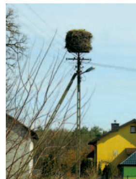
Gniazdo na platformie na słupie energetycznym, Stary Karolinów, gm. Puszcza Mariańska

niestety wskazują na znaczny spadek liczebności bociana na całym obszarze badań.