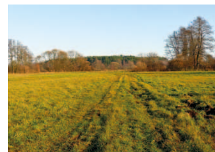
Łąki w kośnym użytkowaniu w dolinie Rawki, Doleck, gm. Nowy Kawęczyn