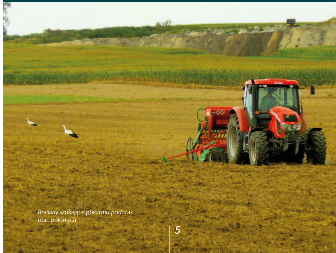
Bociany szukające pokarmu podczas prac polowych

Jeden młody po opuszczeniu gniazda (przez 10 dni) dostaje od rodziców 3 kg + 2,5 kg przed odlotem na zimowisko zbiera sam.