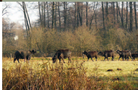
Hodowla bawolów indyjskich w dolinie Rawki, Doleck, gm. Nowy Kawęczyn

Wśród działań służących pomocy bocianom nie może zabraknąć ochrony siedlisk, na których zdobywają pożywnie. Bogate w naturalny pokarm, a przez to szczególnie cenne są wilgotne łąki położone w dolinach rzecznych. Najlepiej im służy pasterskie i/lub kośne użytkowanie, które można zakwalifikować do ochrony czynnej. Na niektórych łąkach (szczególnie z chronionymi gatunkami) można rozważyć utworzenie użytku ekologicznego. Jest to forma ochrony przyrody, która pozwala na dalsze kośne i/lub pasterskie użytkowanie i jednocześnie zwalnia z podatku rolnego (Ustawa z dnia 15 listopada 1984 r. o podatku rolnym). Warto podczas zmiany planu zagospodarowania dla konkretnej miejscowości zgłosić wniosek (każdy to może zrobić) o zakazie zabudowywania i zalesiania dolin rzecznych oraz likwidowania oczek wodnych i starorzeczy. Ponieważ bociany w pewnych okresach polują też na polach, dobrze by było, aby rolnicy stosowali w sposób oszczędny i zrównoważony środki ochrony roślin oraz nie doprowadzali do tworzenia monokultur na znacznych obszarach (np. coraz większe powierzchnie są obsiewane kukurydzą).