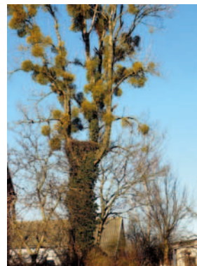
Gniazdo na drzewie, Humin, gm. Bolimów

W Polsce bociany nazywano: polski ibis, bocian pospolity, bocian zwyczajny, bocian czapla, Kajtek, Wojtek, Kuba lub busoń, buseń (na Polesiu). Na Ukrainie – łełeka, czornohuz.