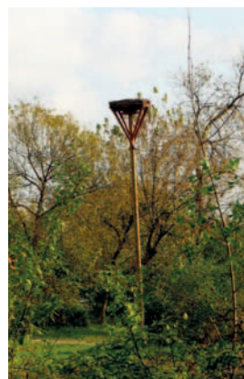
Gniazdo i platforma w Miedniewicach