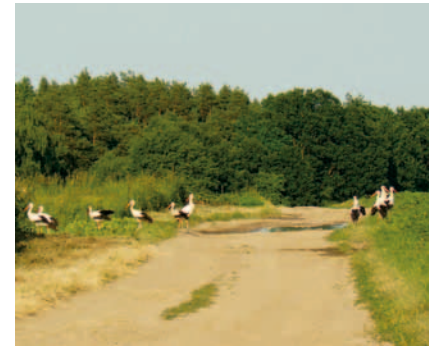
Bociany przy kałuży na polnej drodze. Łatwo tam znaleźć bocianie tropy – ślady nóg odcisnięte w błocie, piasku lub śniegu.