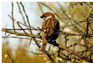
Mazurek (cecha rozpoznawcza: brązowa plamka na policzku)

Dolną część gniazda bocianów często zasiedlają: mazurek, wróbel, szpak, sikora bogatka, pliszka siwa, a rzadziej sierpówka, grzywacz czy sroka.