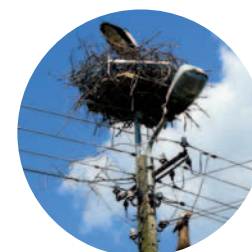
Bocian odbudowujący gniazdo po założeniu platformy. Kuna domowa (porażona prądem), która próbowała dostać się do gniazda szukając pożywienia.