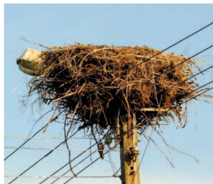
Gniazdo zbudowane bezpośrednio na słupie

Czasem interwencji wymaga nie samo gniazdo, ale to co jest w otoczeniu. Kiedy młode boćki podrastają w gnieździe zaczyna brakować miejsca dla całej rodziny. Dlatego rodzice często odpoczywają lub spędzają noc na pobliskich dachach lub słupach. Niestety niezabezpieczone rozłączniki lub stacje transformatorowe stają się wtedy śmiertelnym zagrożeniem. We wsi Kamionka (gm. Wiskitki) dzięki zgłoszeniu przez mieszkańca takich zdarzeń, interwencji Oddziału Terenowego Bolimowskiego Parku Krajobrazowego i działań podjętych przez zakład energetyczny PGE