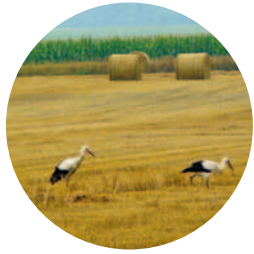
Młode bociany polujące podczas żniw