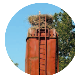
Gniazdo na silosie, Wola Wysoka, gm. Skierniewice