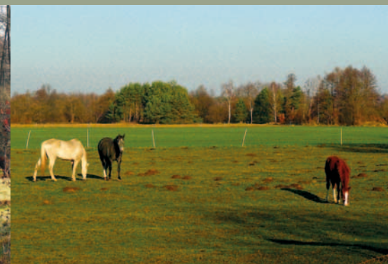
Konie na pastwisku w dolinie Rawki, Suliszew, gm. Nowy Kawęczyn