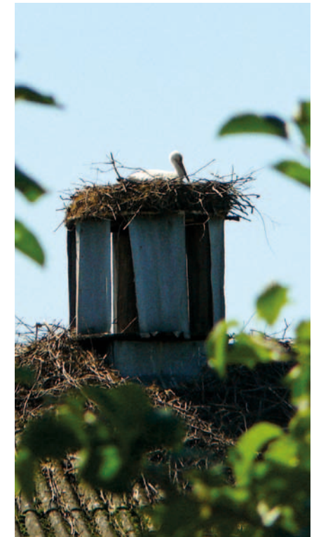
Młody „rozrabiaka” z Łubna. Gniazdo na platformie wykonanej przez właściciela gospodarstwa

Czasami bociany czują się tak bezpiecznie w obejściu, na którym mają gniazdo, że żerują wśród zwierząt gospodarskich i stawach przydomowych. We wsi Michałowice (gm. Kowiesy) bocian wyjadał małe kaczki i kurczaki na sąsiednim podwórku (co szybko stało się powodem kłótni). W Trzciannie (gm. Nowy Kawęczyn) młody bocian, który nie odleciał na zimowisko, mieszkał z kurami w kurniku. Gdy tylko gospodarze pozostawili uchylone drzwi do domu w porze obiadowej, wchodził do kuchni i podjadał zupę z talerzy. W Łubnie (gm. Wiskitki) właściciele stodoły z gniazdem bocianim twierdzili, że młode lubią skakanie po ich samochodach (rysując przy tym pazurami maski i dachy aut).