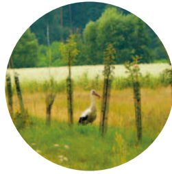
Bocian żerujący w młodym sadzie