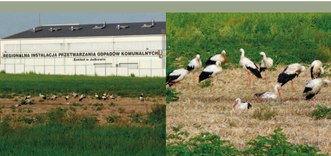
Bociany (prawdopodobnie nie lęgowe) po żerowaniu na śmietniku często odpoczywają w jego sąsiedztwie

Zjadanie przez bociany padliny przyczynia się w sposób bezpośredni do ograniczenia rozprzestrzeniania się groźnych bakterii związanych z rozkładającym się mięsem. Wysoka odporność u bocianów sprawia, że mimo nieświeżego pożywienia nie chorują one na toksoplazmozę i listeriozę.