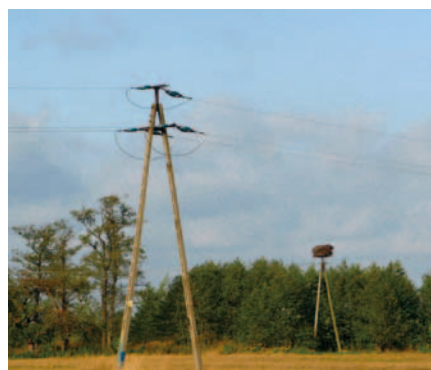
Zabezpieczony słup energetyczny w Kamionce

Dystrybucja Oddział Łódź udało się wyeliminować ten problem.